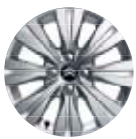
16" Blade Alaşımli jant