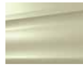
Fındık Sarı (M)