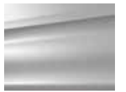
Milyum Gümüş (M)